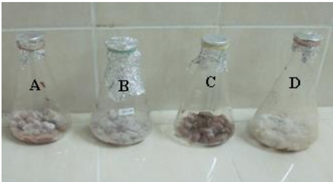
Gambar. 1. substrat dengan Saccharomyces cerevisiae (A), campuran Aspergillus niger dan Saccharomyces cerevisiae (B), Saccharomyces cerevisiae yang ditumbuhkan dalam media sirup jagung (C), Aspergillus niger (D).

Berdasarkan hasil pengamatan dengan uji sensori telah diperoleh fakta bahwa pada hari ketiga pertumbuhan hifa paling banyak adalah pada substrat yang difermentasikan dengan Aspergillus niger , lalu diikuti substrat yang diberi campuran Saccharomyces cerevisiae dan Aspergillus niger , substrat yang diberi Saccharomyces cerevisiae , dan yang paling sedikit hifanya adalah substrat yang diberi Saccharomyces cerevisiae yang telah ditumbuhkan dalam media sirup jagung.